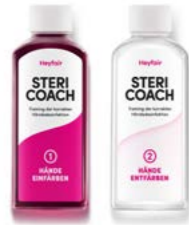
150ml Färber & 150ml Entfärber