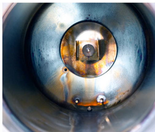
Ohne regelmäßige Kesselreinigung