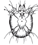
Milbe Sarcoptes scabiei