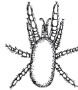
Rote Vogelmilbe Dermanyssus gallinae