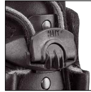
HAIX® Fast Lacing Fit System