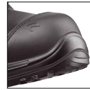
HAIX® Composite Schutzkappe