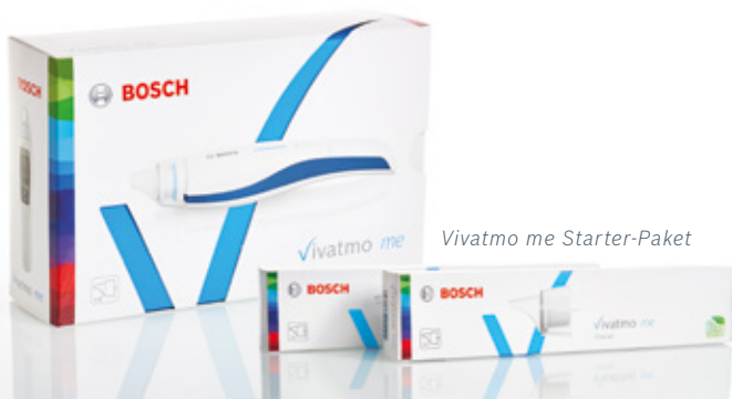
Vivatmo me Starter-Paket

Die Vivatmo app mit Tagebuchfunktion und Polleninformation sowie das Vivatmo Coach Angebot für den einfachen Start erhalten Sie kostenlos dazu.