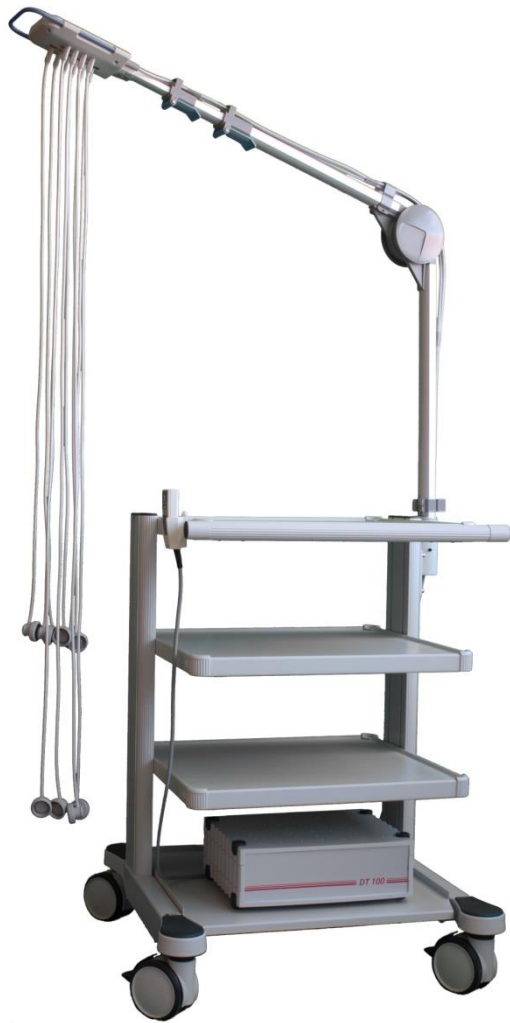
[Abbildung Gerätewagen mit Sonderausstattung]